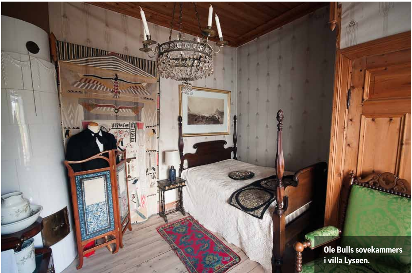
Ole Bulls sovekammers i villa Lysøen.