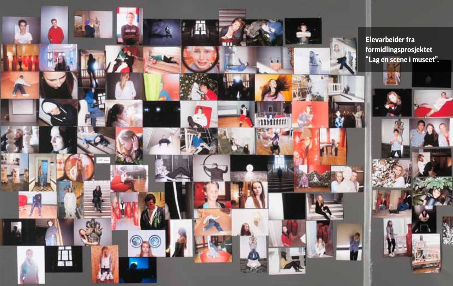
Elevarbeider fra formidlingsprosjektet "Lag en scene i museet".