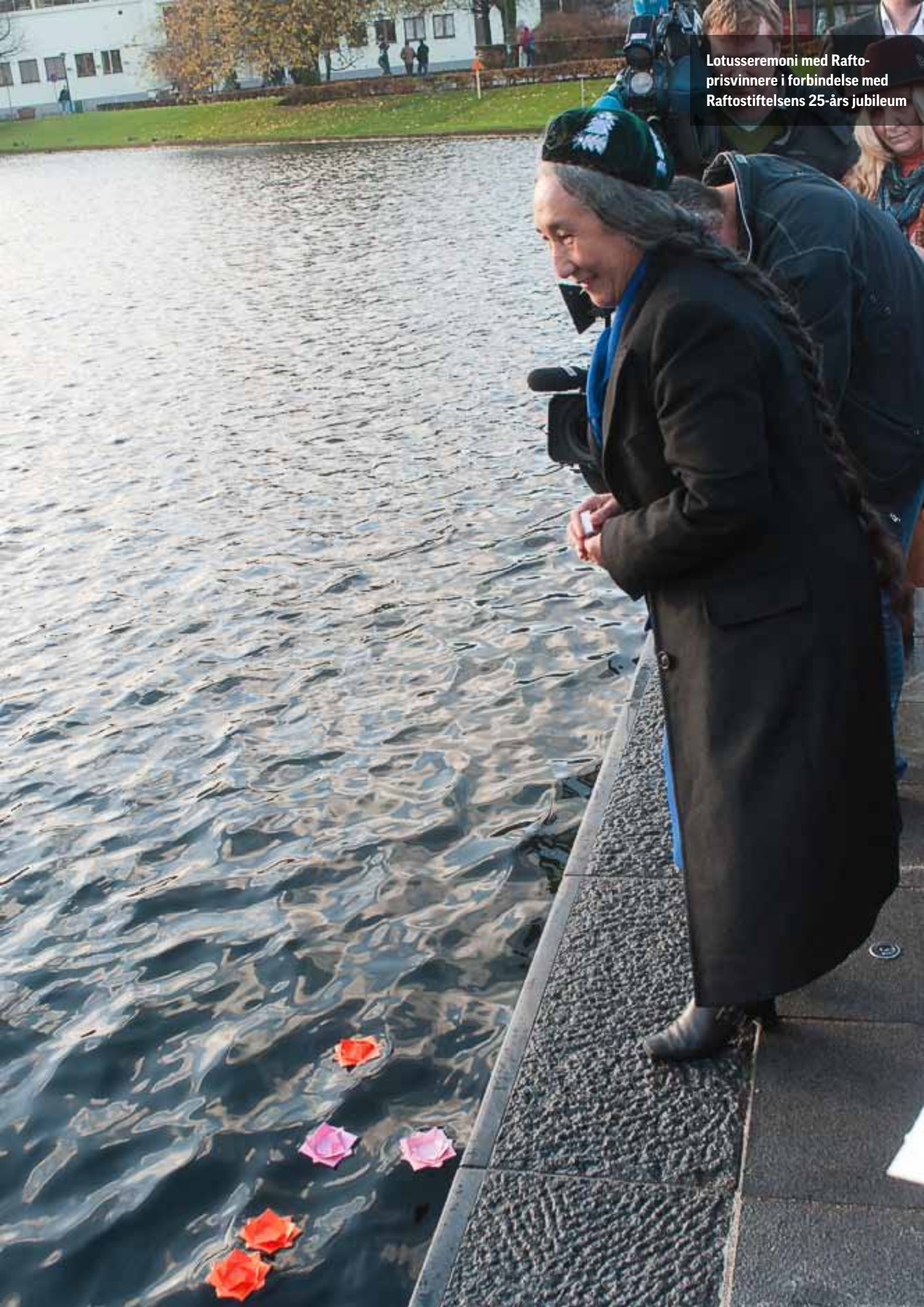
Lotusseremoni med Rafto- prisvinnere i forbindelse med Raftostiftelsens 25-års jubileum