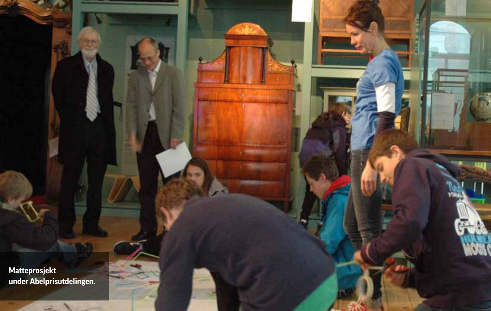
Matteprosjekt under Abelprisdelingen.

lomtrinn, ungdomstrinn og videregående skole deltok i utstillingen.