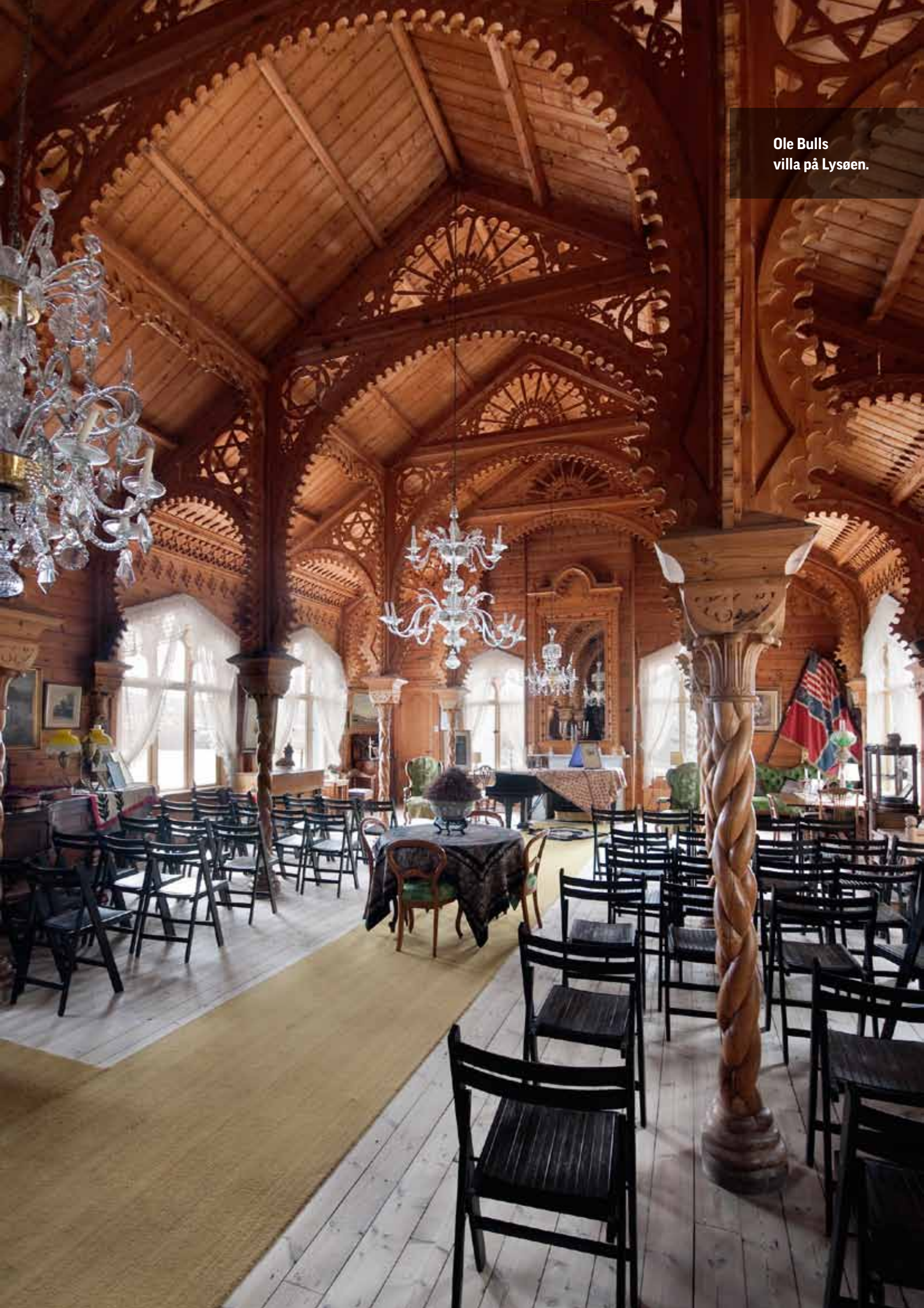
Ole Bulls villa på Lysøen.