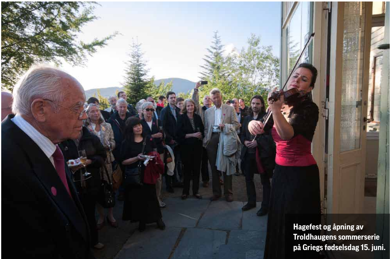
Hagefest og åpning av Trolldhaugens sommerserie på Griegs fødselsdag 15. juni.