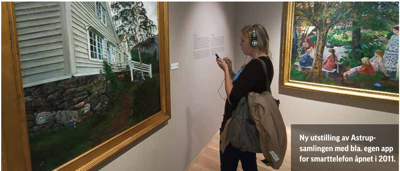
Ny utstilling av Astrup-samlingen med bla. egen app for smarttelefon åpnet i 2011.