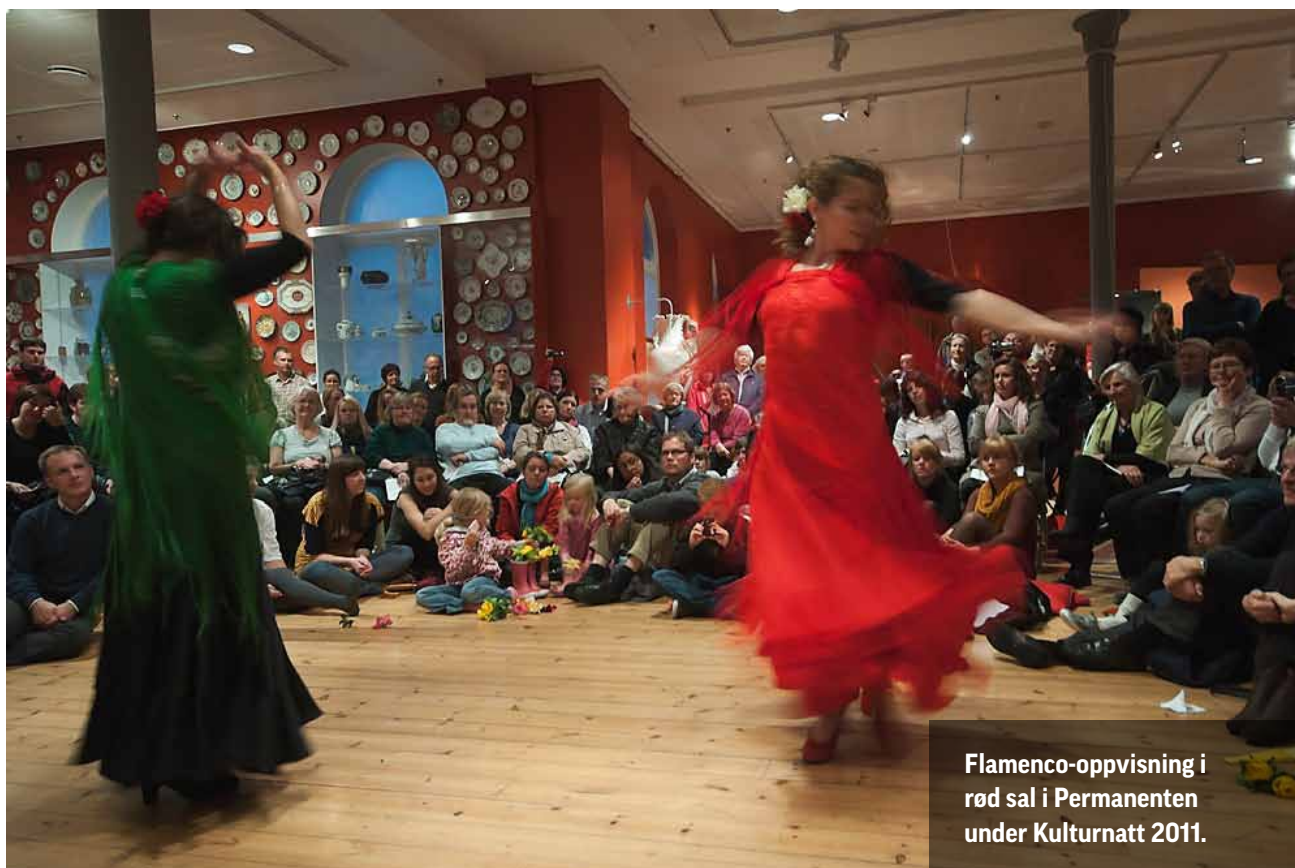
Flamenco-oppvisning i rød sal i Permanenten under Kulturnatt 2011.