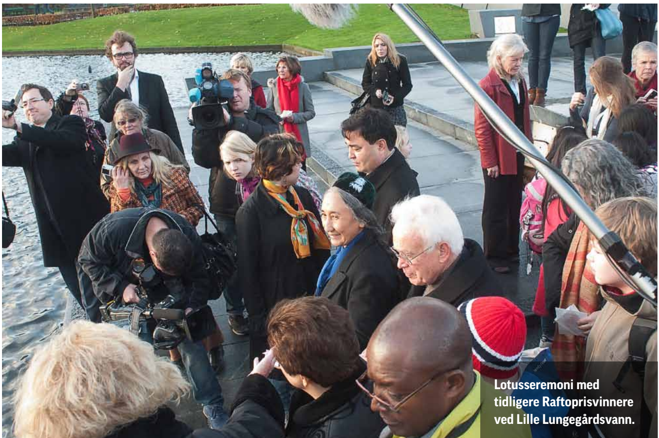
Lotusseremoni med tidligere Raftopprisvinnere ved Lille Lungegårdsvann.